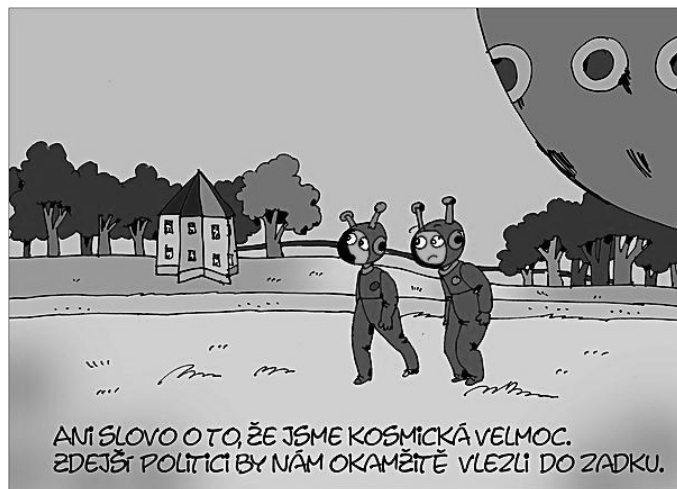
• Kresba: Michael Marčák

27. února 2008, při návštěvě USA „Radar bude pro ČR oázou bezpečí a Radar je pro ČR věc zajímavá a vysoce prestižní.“