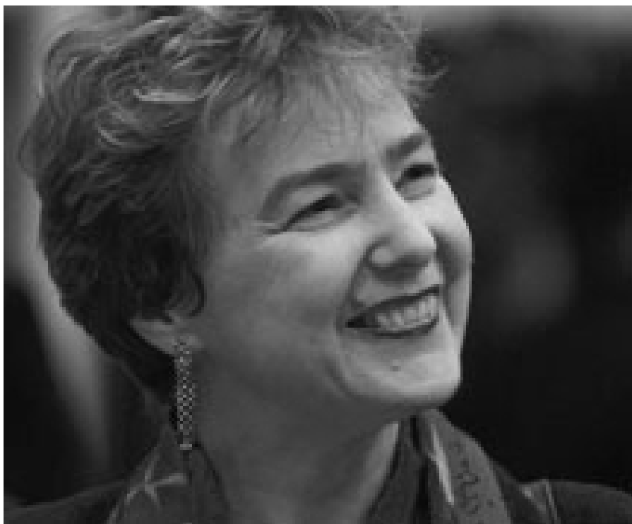
• Kate Hudson – Kampaň za jaderné odzbrojení, Velká Británie

O tázka z pohledu mezinárodního práva se může zdát nudná, ale ve skutečnosti je vysoce důležitou. Pohled na smlouvy, které se nějak dotýkají protiraketové obrany, a na to, kdo je podporuje, nám řekne mnoho o něčí globální politice a jeho ambicích.