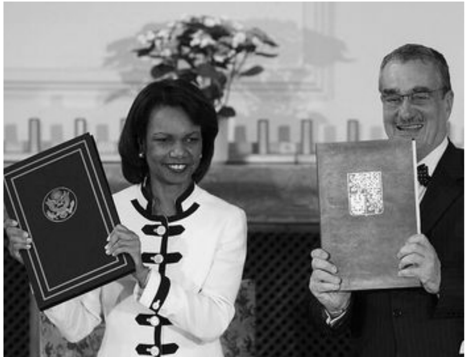
• Smlouvu podepsali C. Riceová a K. Schwarzenberg

Vsouvání s radarem vzniknou státu podle všeho i určité náklady, přinejmenším v důsledku ustanovení Článku XIV, 1. smlouvy, který říká, že ČR „odpovídá za zajištění ... vnější bezpečnosti a ochrany radarové stanice.“ Smlouva se nepřímě dotýká i bezletové zóny v okolí radaru (Článek XII, 8.), o je-