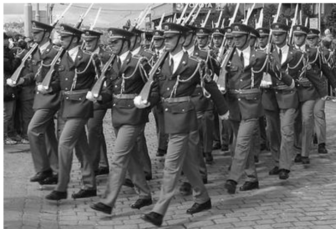
• Vojenská přehlídka v Praze

Důvody, proč se Greenpeace rozhodlo přispět tímto způsobem k vojenské přehlídce u příležitosti oslav 90. výročí založení Českoslo-