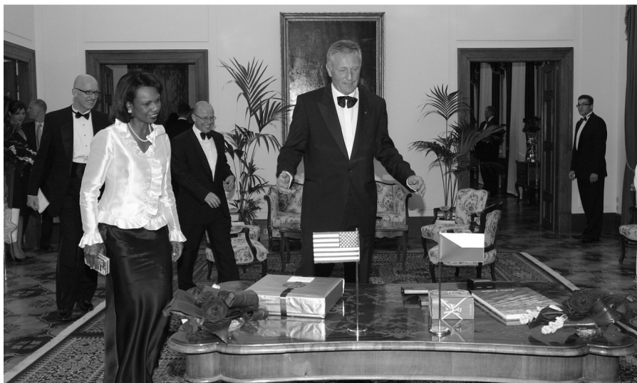
• C. Riceová a M. Topololánek v den podpisu smlouvy o radaru

I niciativa Ne základnám reaguje tímto na „Dohodu mezi Českou republikou a Spojenými státy americkými o zřízení radarové stanice protiraketové obrany Spojených států v České republice,“ neboli tzv. Hlavní smlouvu, kterou 8. července 2008 v Praze podepsali Karlem Schwarzenberg a Condoleezza Rice.